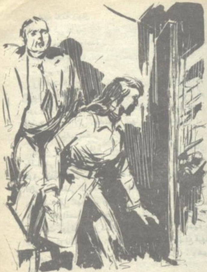
صحبهما بسرعة إلى السلم الخلفي ، وهبطا في درجات سلم الطابقين في سرعة ، على الرغم من ضخامة جسد (قدرى) ..

صحبهما بسرعة إلى السلم الخلفي ، وهبطا في درجات سلم الطابقين في سرعة ، على الرغم من ضخامة جسد (قدرى) ، ولكن في نفس اللحظة التي بلغا فيها الباب الخلفي ، توقفت سيارة من سيارات الأمن الإسرائيلية أمام الباب ، وسمعت (منى) صوت (موشى) ، وهو يقول في صرامة :